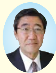
常務理事・事務局長