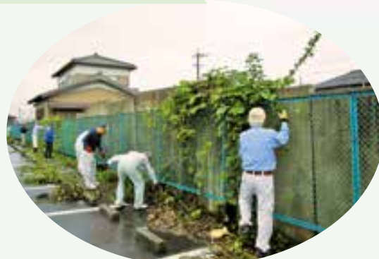
神田幼稚園・東員保育園 園庭除草・清掃作業