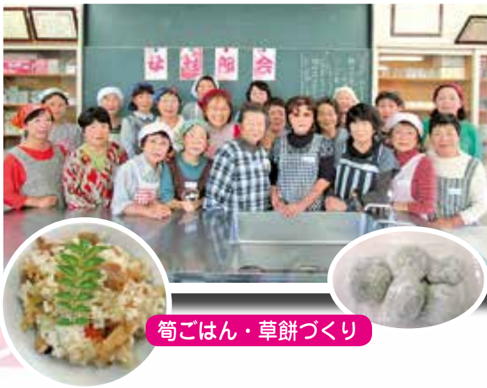
筒ごはん・草餅づくり