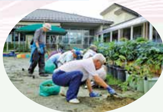
笹尾西幼稚園・笹尾第一保育園 園庭除草・清掃作業