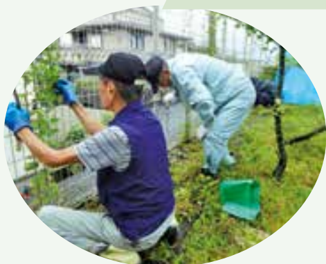
笹尾東幼稚園・笹尾第二保育園 園庭除草・清掃作業