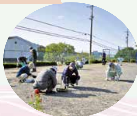
城山幼稚園・しろやま保育園 園庭除草・清掃作業