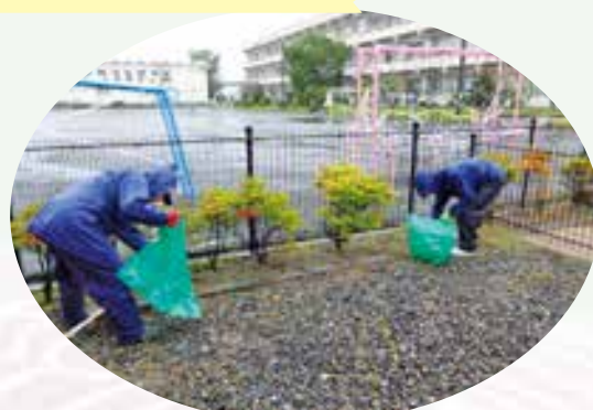
三和幼稚園・みなみ保育園 園庭除草・清掃作業