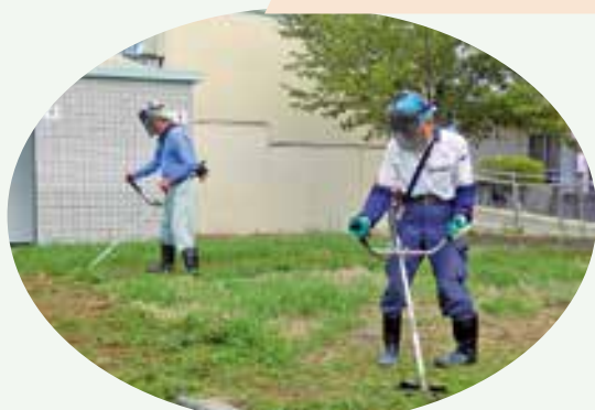
稲部小学校校庭・ 保育園／幼稚園園庭 除草・清掃作業