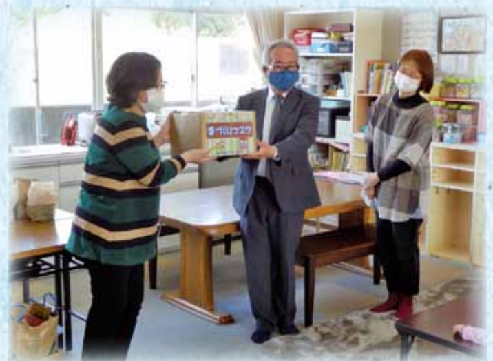
学童クラブへ手づくりマスク寄贈