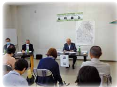
令和2年度 定時総会