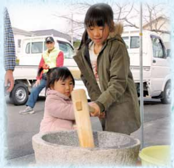
しるばーもちつき大会