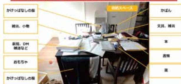
テーブルの整理・整頓 【演習3】 一例

今後の新型コロナウイルス感染拡大の状況によっては、開催について変更される場合があります。