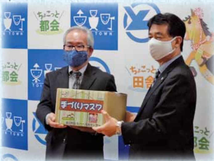
町へ手づくりマスク寄贈