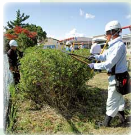
植木の手入れ講習