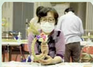
稲わらリースづくり