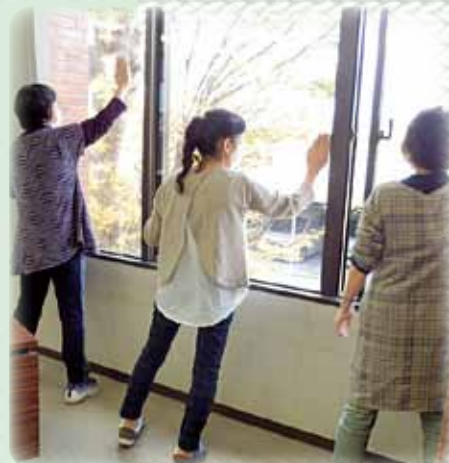
きちんと片付け&掃除講習