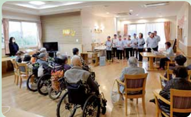
コーラス施設訪問