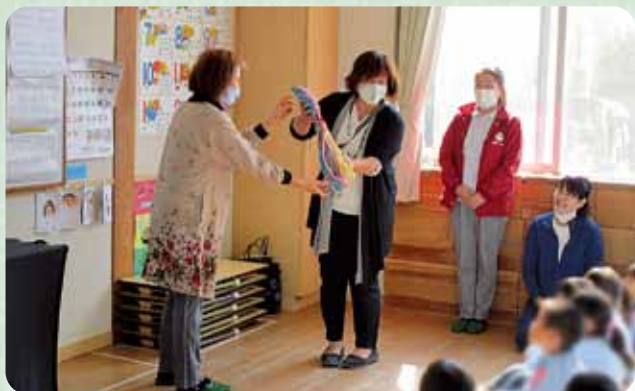
あやとり贈呈 (保育園・幼稚園)