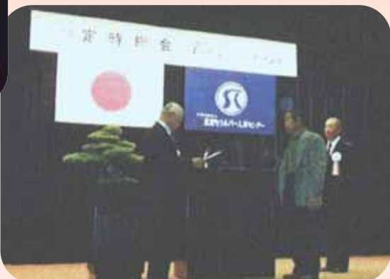
▶剪定班を 無事故表彰する