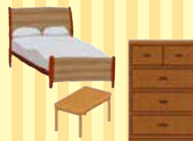
居室の片付け 簡易な家具移動