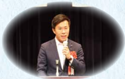
三重県議会議員 石垣智矢 様