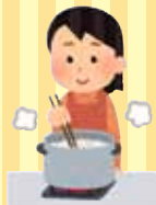
調理・配膳・片付け