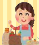
日用品のお買い物