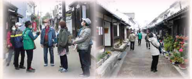
～奈良県橿原市今井町～