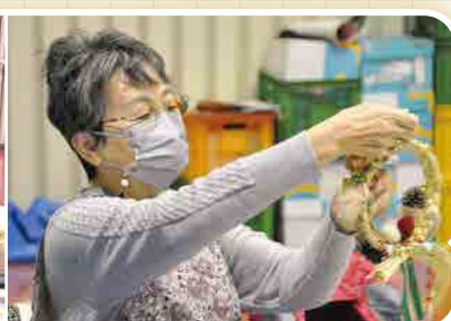
稲わらリース づくり体験