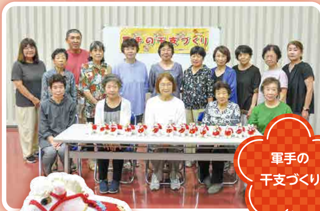
軍手の 干支づくり