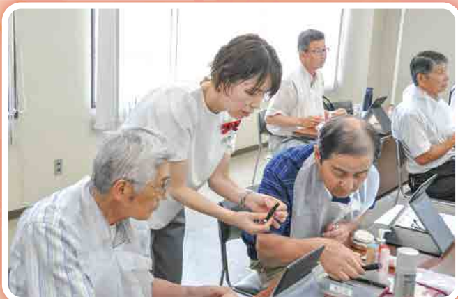
おとこ塾身だしなみ教室