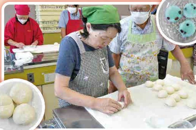
パンと夏のデザートづくり教室