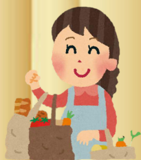
日用品のお買い物