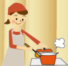
調理・配膳・片付け